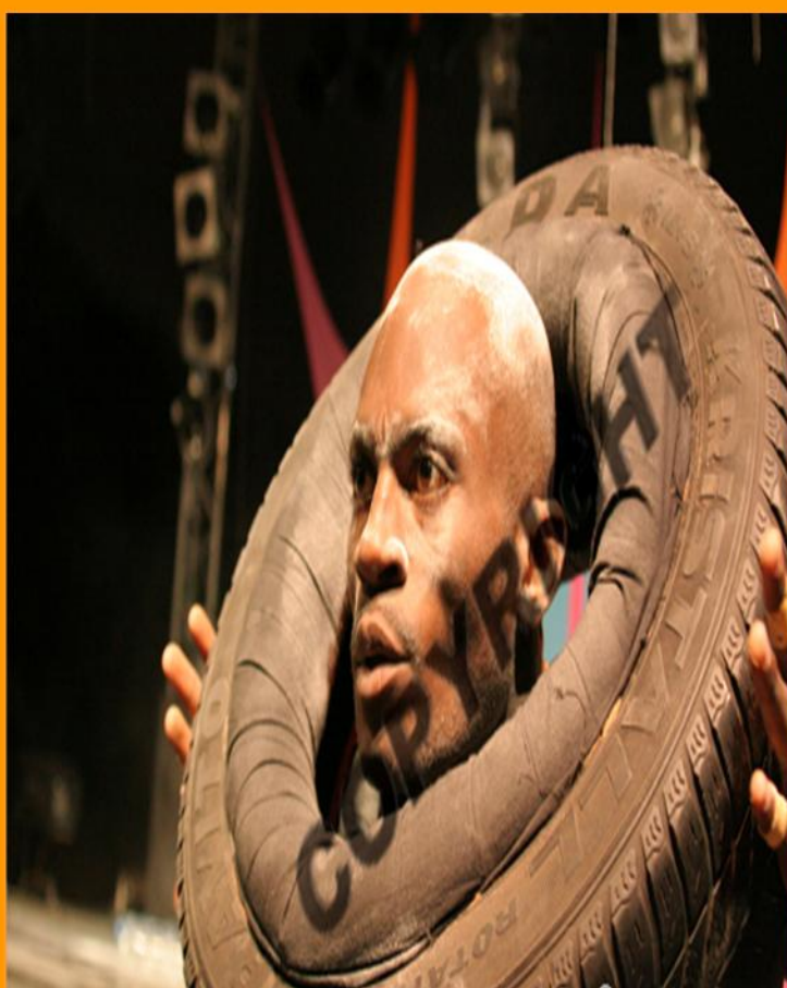
Spectacle de danse contemporaine interprété par la Compagnie Banninga, image de la société africaine, où « la pollution des rues » se mêle à la « pollution des âmes »