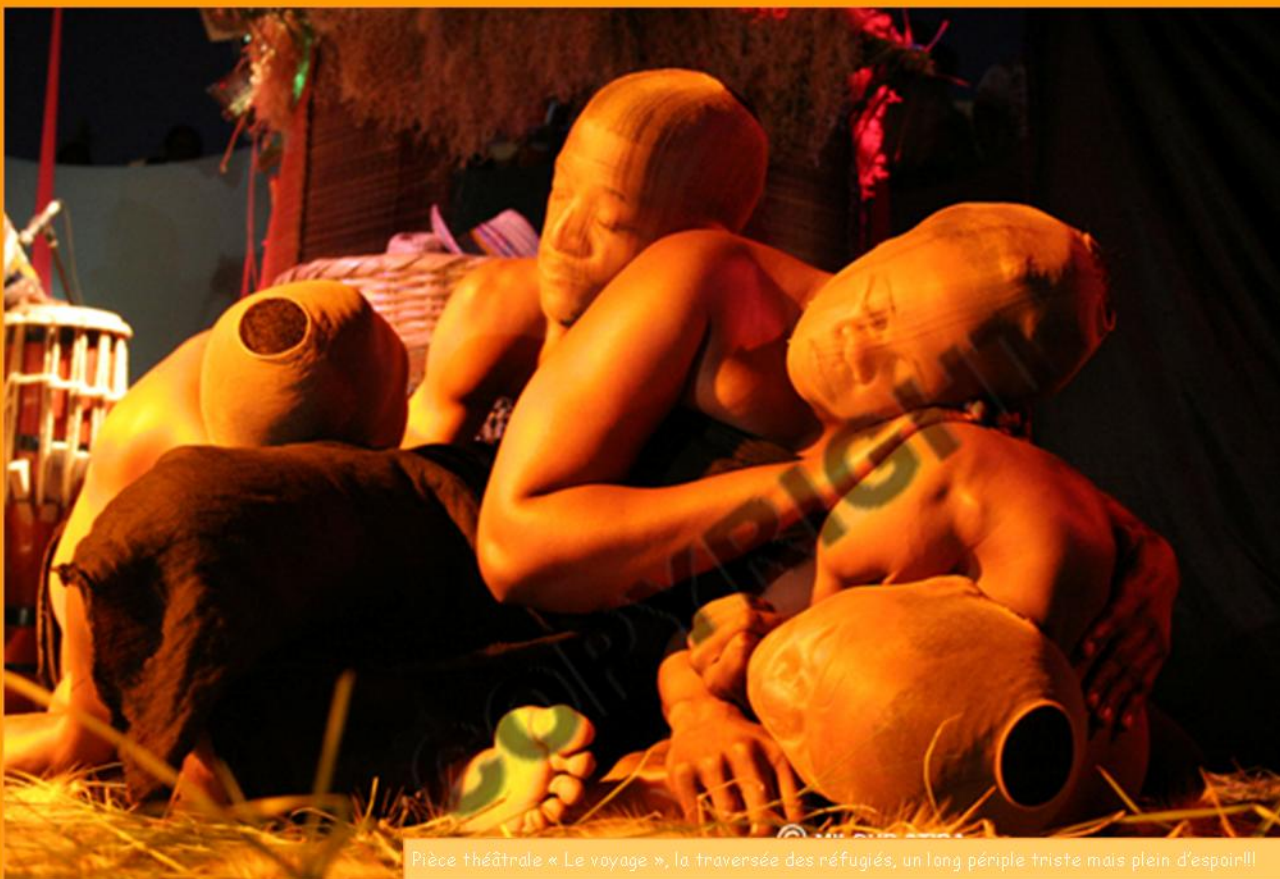
Pièce théâtrale « Le voyage », la traversée des réfugiés, un long pèlerinage triste mais plein d'espoir!!!

A travers l'art, le festival Saga Africa a ouvert la voie à l'égalité entre les hommes et se veut symbole de dialogue et d'expression culturelle. Organisées au Maroc, terre d'Afrique et trait d'union entre les pays du Nord et du Sud, les festivités ont rendu hommage à la musique africaine et ses talents.